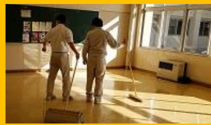
3年生 感謝を込めて教室のワックス塗布