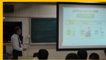
3年生に年金セミナーを開催しました