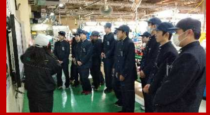
現場見学会 電子機械科1年生