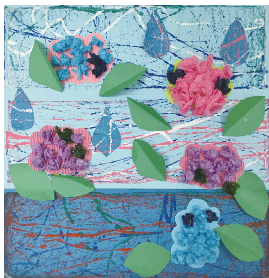
「 ピー玉アート ～あじさいのある風景～」