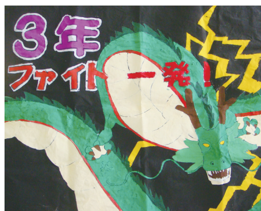
「 Fight! 一発 」 岩手県立気仙光陵支援学校 高等部 3年一同

これからは何か一つ、私にとって今までに経験したことのない幸せになるための目標が欲しいです。そのためにはコミュニケーションが大事だと思っています。今よりもっと幸せな自分、素直な自分、優しい自分になりたいと思います。未来の自分がどう変わっていけるのか、とても楽しみです。