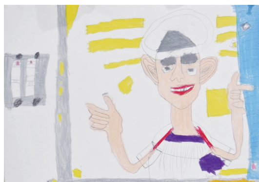
「盛岡市内合同運動会」