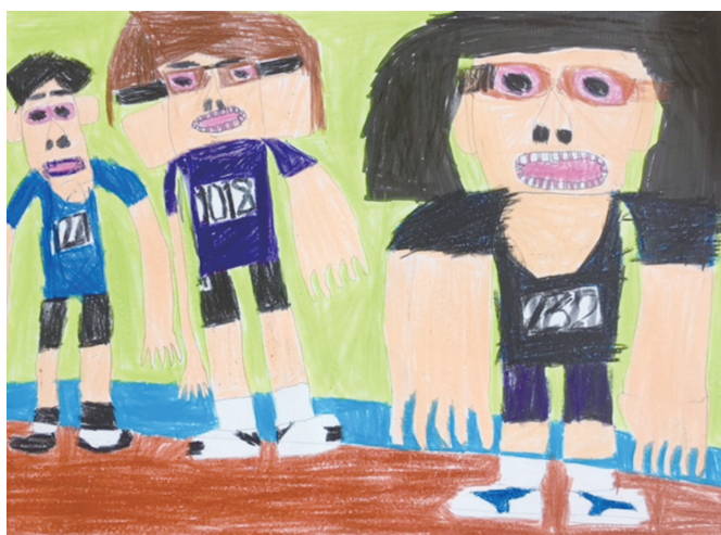
「 TRY スポーツ 」

私が今後挑戦してみたいことは、自分の作ったアクセサリーを通販サイトで販売することです。私は昔から自分のつくった物を売ることが夢だったので、最近minneなどのことを知って、自分もやってみてみたいと思いました。今はまだ模索中ですが、いつかできたら、うれしいです。