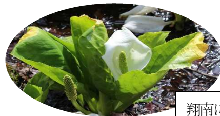
翔南に咲く水芭蕉