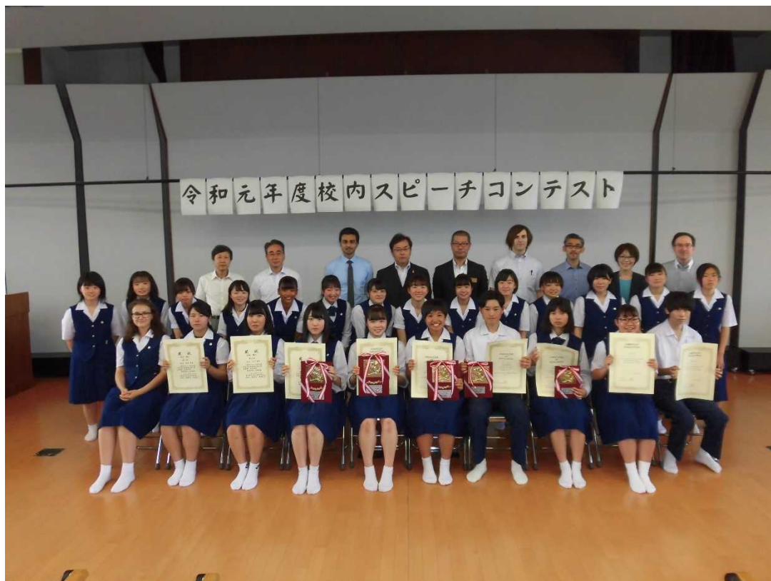
Concours d'éloquence du département des langues étrangères