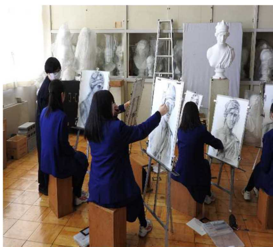
Elèves du département artistique