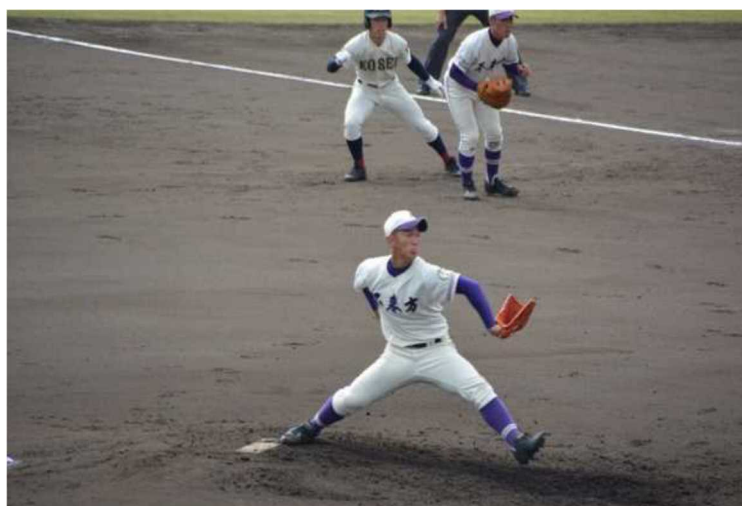
Le club de baseball