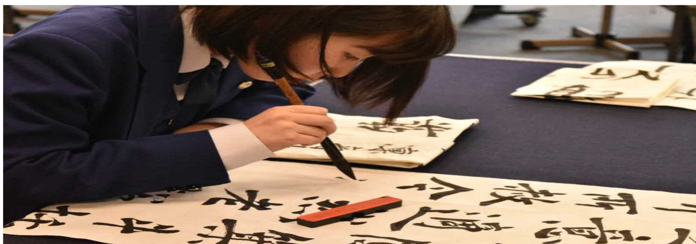
Le club de calligraphie