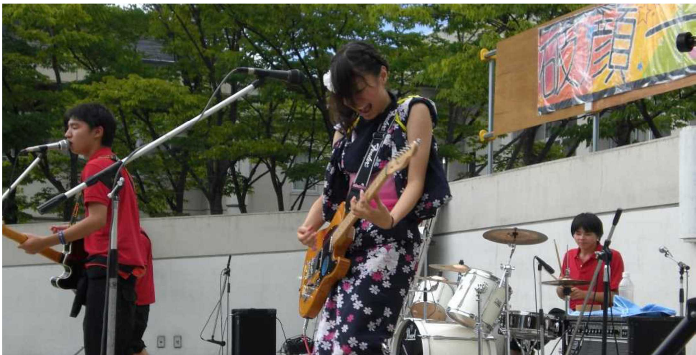
Pendant le Shokakusai, la fête du lycée