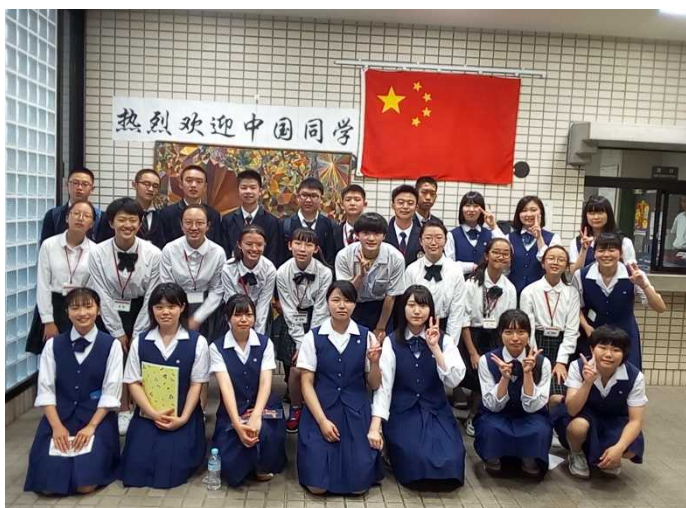
Des lycéennes chinoises en visite à Kozukata