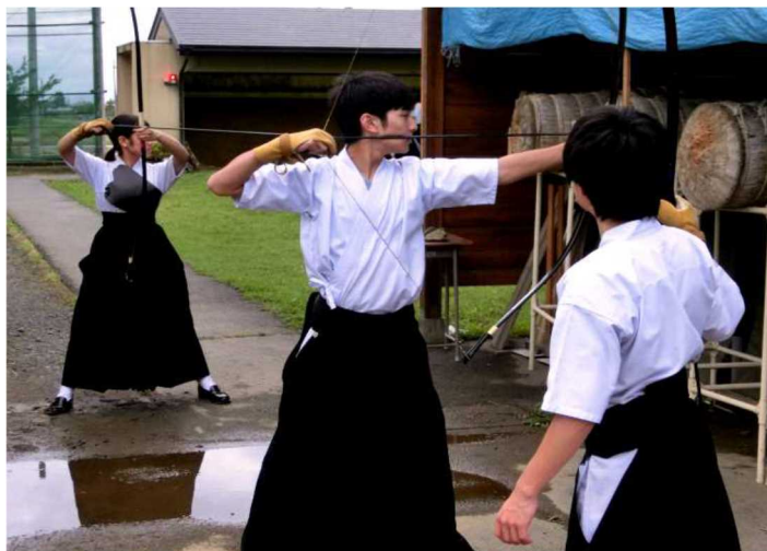
Le club de tir à l'arc (kyudo)