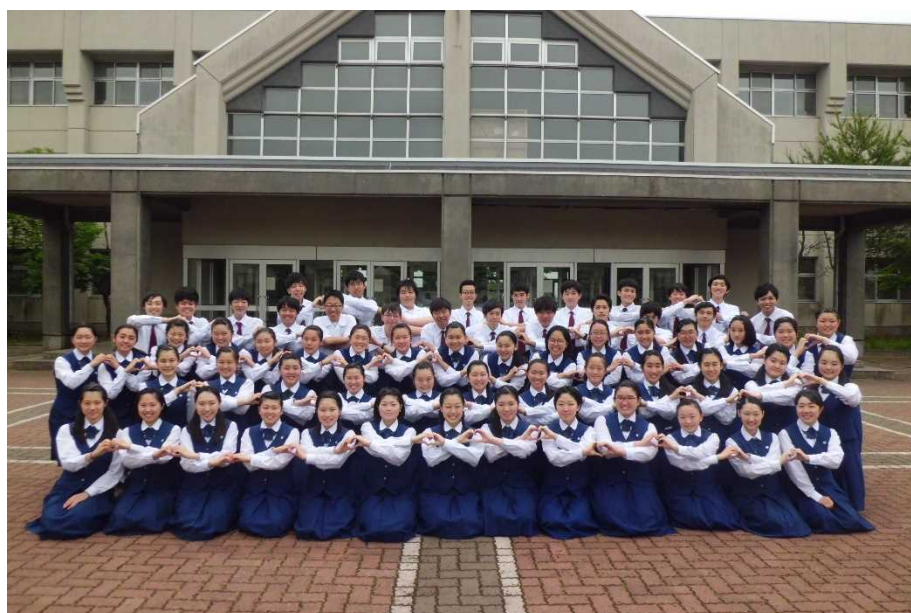
La chorale du lycée