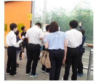
「いわて銀河農園」見学