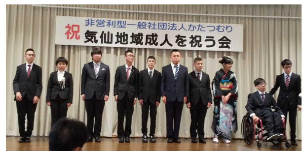
しんせいじん 新成人のみなさん