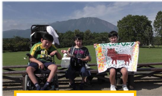
バンジートランポリンで テンションMAX!!!