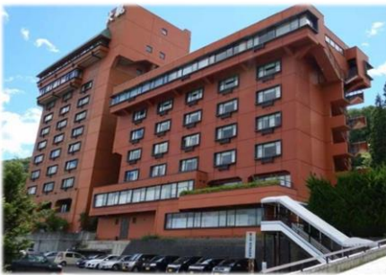
ホテル大観で温泉や 豪華な食事を満喫!