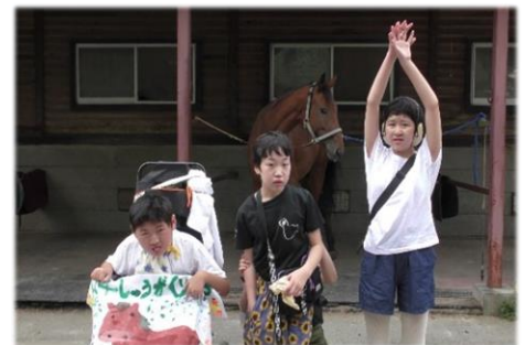
馬っこパークで乗馬や 馬車を体験しました!