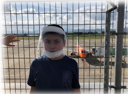
オレンジの飛行機見たよ

小学部高学団は9月29日(水)～30日(木)に、花巻方面へ宿泊学習に行ってきました。1日目は、山猫軒での昼食と、花巻空港の見学の後、少し北へ移動してラ・フランス温泉館に宿泊しました。2日目は、花巻おもちゃ美術館で活動をし、マルカンビル大食堂で昼食を取りました。様々な体験をし、楽しくて色々美味しい宿泊学習になりました。