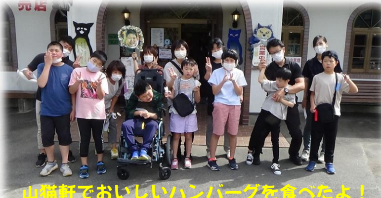
山猫軒でおいしいハンバーグを食べたよ！