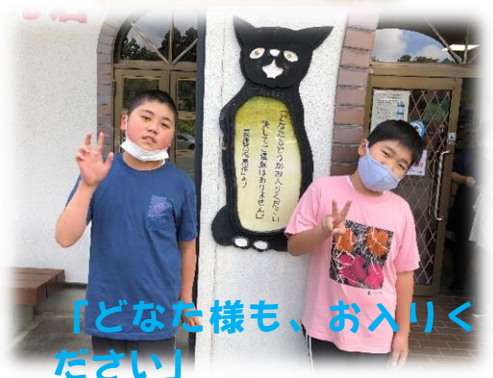
「どなた様も、お入りください」