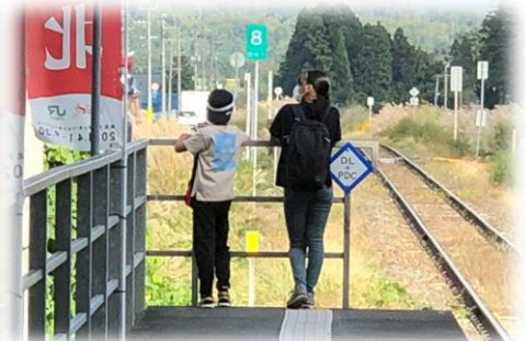
早く列車来ないかな～