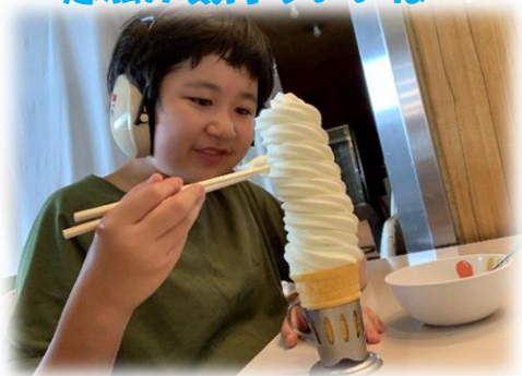
おはしで挑戦しました！