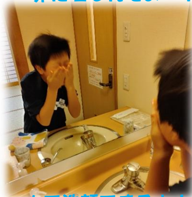
一人で洗顔できるよ！