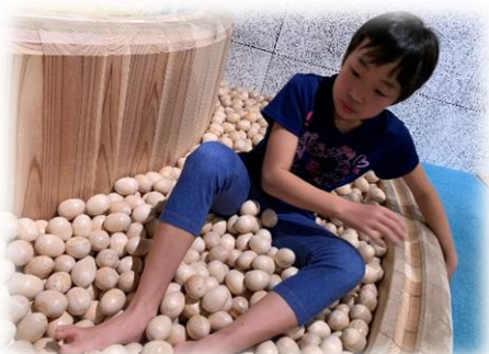
感触が気持ちいいね