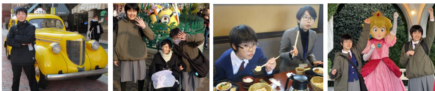
みんなで行った3泊4日の旅行は、本当に楽しかったなあ～ また、いつか行ってみたいです!!