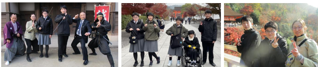
なかなか味わうことのできない体験です！ 大坂・京都はちょうど紅葉がきれいでした！