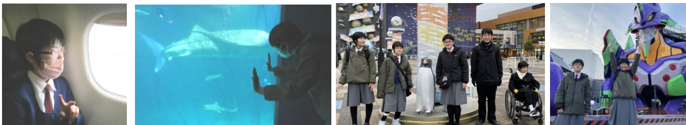
花巻空港から飛行機に乗って、いざ、関西へ！ 楽しいことがいっぱい待っています・・・

12月5日(火)～8日(金)の3泊4日の日程で、大阪・京都方面に修学旅行に行ってきました。1日目は、世界最大級の水族館である海遊館で、海の生き物を見ました。2日目は、「清水の舞台」で知られる清水寺と「お稲荷さん」総本宮である伏見稲荷大社、東映で有名な太秦映画村に行きました。3日目は、一番楽しみにしていたUSJです。ミニオンやスパイダーマンなどのアトラクション、買い物で1日を満喫しました。旅行中は天気に恵まれ、それぞれたくさんの楽しい思い出を作ることができました。忘れられない一生の宝になりました。