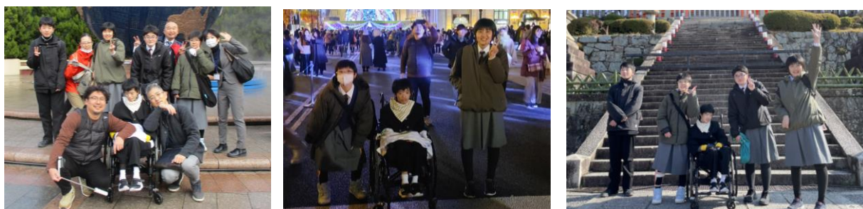
10人で行った修学旅行、全てがまるで夢のようでした！ もう、忘れられない一生の宝です・・・