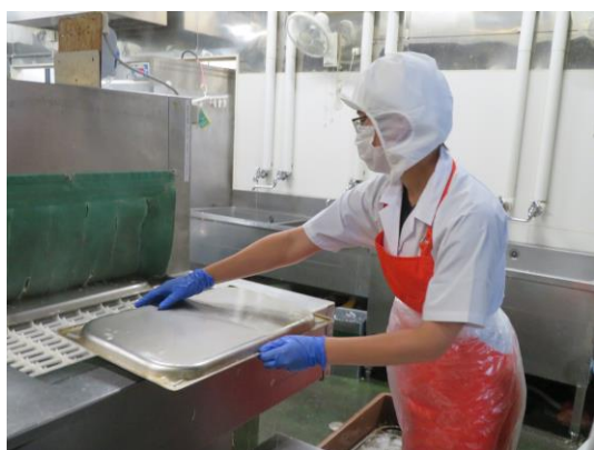
【基石給食】 洗浄作業