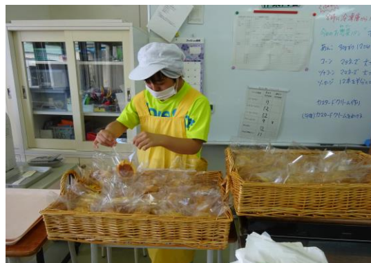
販売も行いました。 毎日完売で大好評でした！