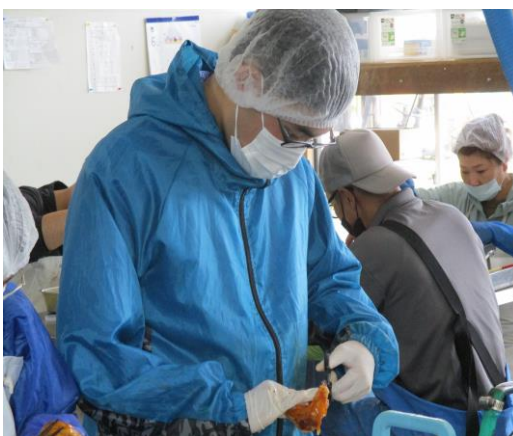
【三陸ラボラトリ】 ホヤむき作業