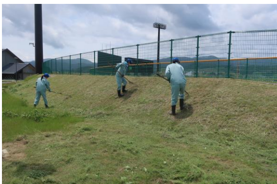
陸前高田の野球場の草刈り・草集 めに行きました