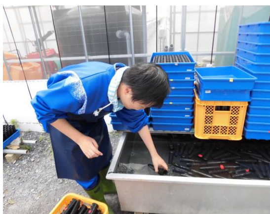
【せせらぎ】 ポットの洗浄作業