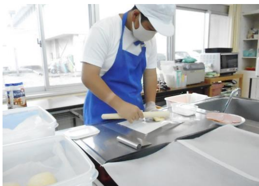
A班は主にパン作りを行いました。 正確に手順通りに作るために集中 してがんばりました。