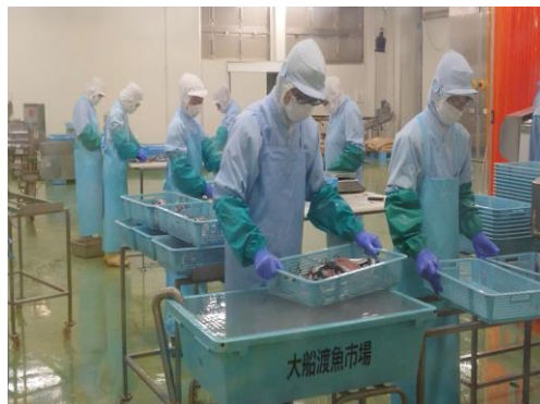
【鎌田水産】 鮮魚加工