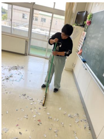
B班は清掃・環境活動を行いました。 隅々まで丁寧に、様々な道具の使い方も 学びました