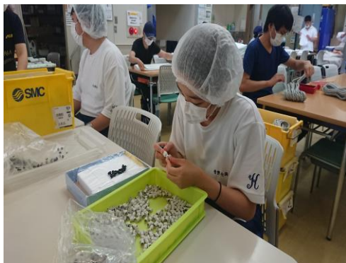
【朋友館】 部品組み立て