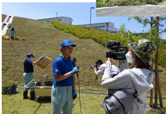
広田町にある野外活動センターにも草刈りへ TVの取材も入り、緊張しています・・・