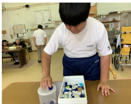
【第2高松園】 日中活動