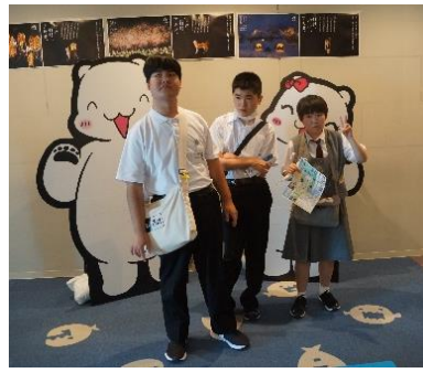
ホッキョクグマが好きです