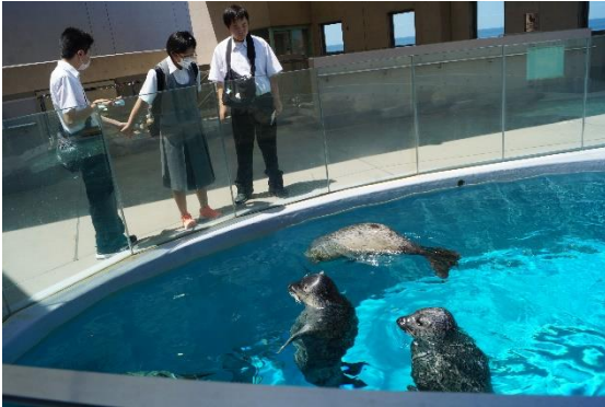
アザラシがとってもかわいいです！