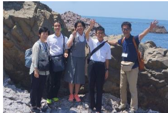
海は気持ちいいなあ～