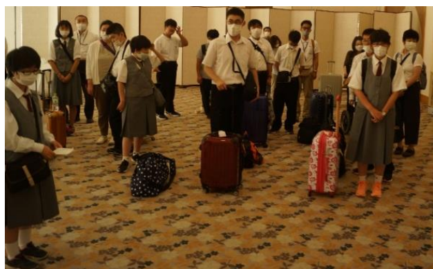
大潟村のホテルに着きました