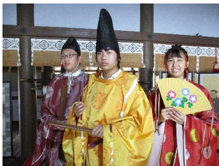
私たち、平安貴族に変身しました