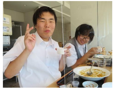
カンカレーは最高です！