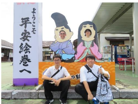
えさし藤原の郷に、やって来ました