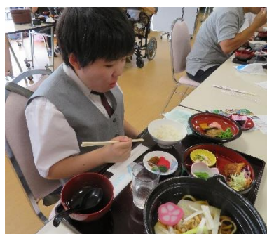
どれから食べようかしら…