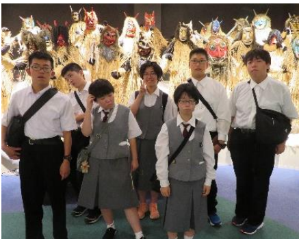
秋田のなまはげが大集合！