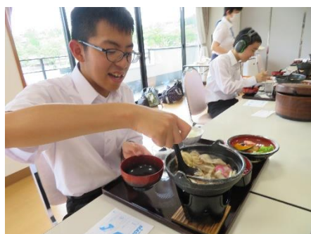
鍋焼きうどんが、美味しそうです