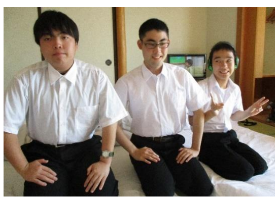
皆で泊まるって、楽しいです！