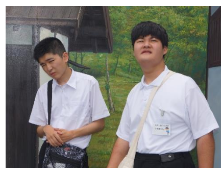
映画やドラマのロケもやるそうです