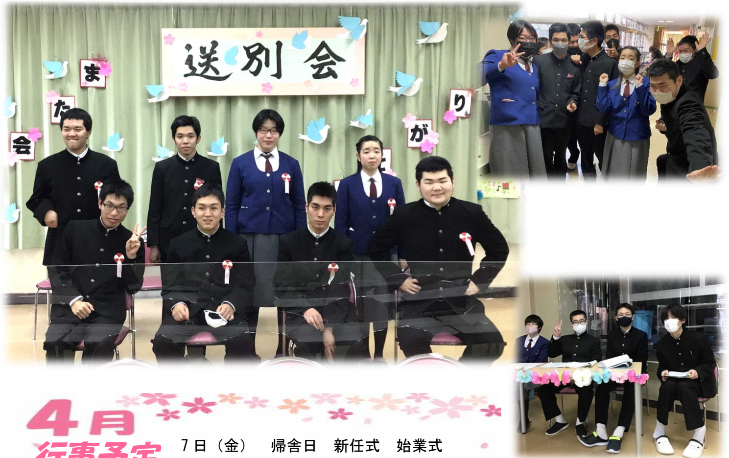
送別会実行委員の皆さん お疲れ様でした!!