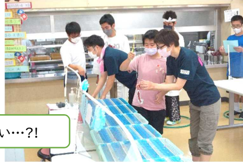
目指せ大漁!魚釣り☆ 高級魚が釣れるとアツい…?!