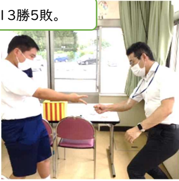
校長先生・副校長先生と、ガチのじゃんけん勝負! 大人の矜持が見えた、13勝5敗。

表彰式、夕食 夕食前に表彰式を行い、賞品の贈呈。お祭りメニューの夕食にも大満足☆