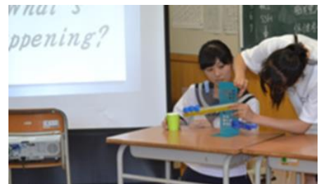
実験内容を英語でプレゼン中...

また、地域の高校生がどんなことに疑問を感じ、どのようなことに興味を感じ、どんなことを考えているのかを知っていただける良い機会になればとも考えております。是非、ご来場ください。