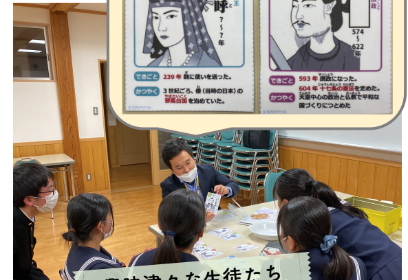
興味津々な生徒たち