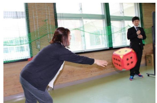
サイコロトーク 2018 開催しました。