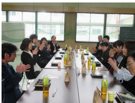
安定のハローランチ！ いただきますよ！