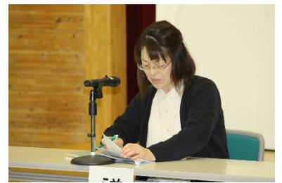
佐野会長、今年度もよろしくお祈いします。