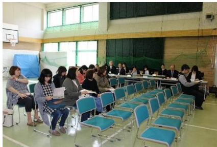
お忙しい中の参加ありがとうございました。