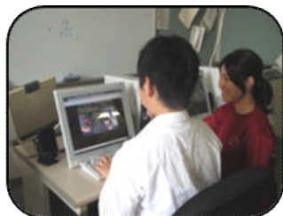
音声パソコンの操作法