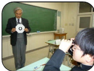
弱視レンズの使用法