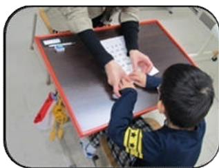
点字習得に向けた学習