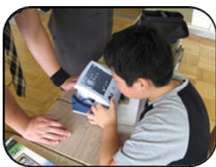
拡大読書器の使用法