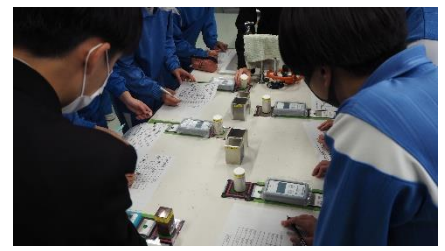
中学生の前で放射線の特性について説明する関工生と実験の様子