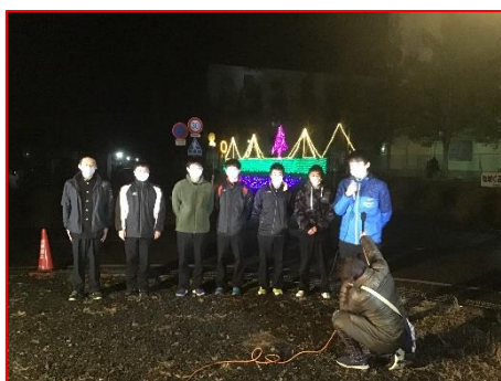
点灯式での生徒コメント