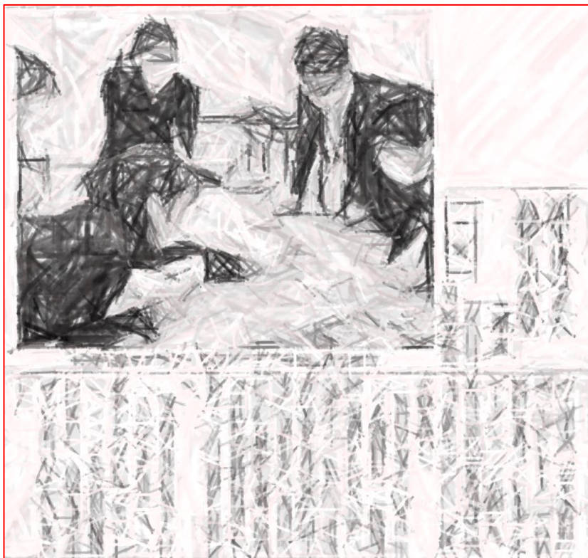
岩手日報 令和2年11月11日