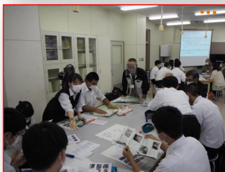
秋の文化祭行事などの話がされています。