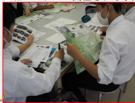
防災マップの説明を聞いています。