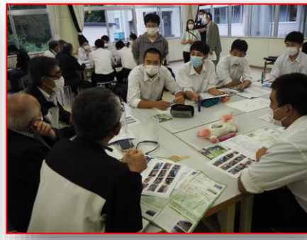
出前授業を提案しています。