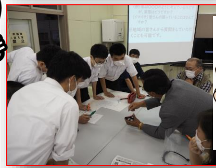
携帯でHPを紹介しています。