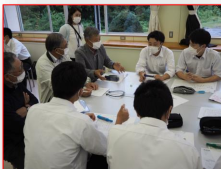
地域の課題を聞いています。