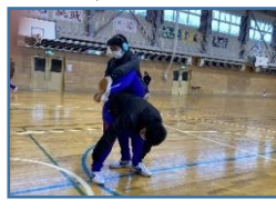
友達と馬跳びしたり