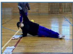
脇腹を伸ばしたり