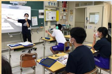
修学旅行事前学習

修学旅行まで3年生と1・2年生に分かれて学習することが続いています。今週は、3年生は修学旅行に向けて事前学習を頑張っていて、「〇〇が楽しみ」と、うきうきした声が連日聞かれます。1・2年生は、新人戦応援活動、作業等、3年生がいつも引っ張ってくれている部分も自分たちで頑張っている様子です。