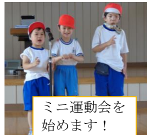
ミニ運動会を始めます！