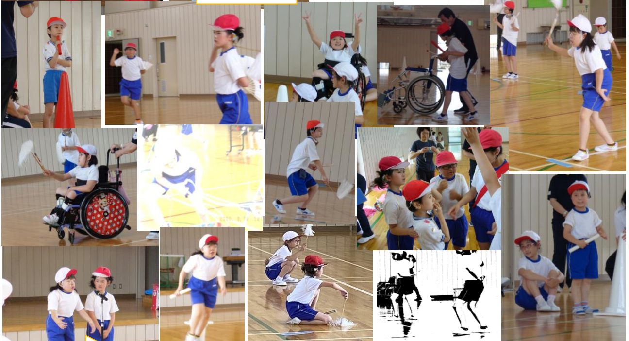
りっぱな感想発表！