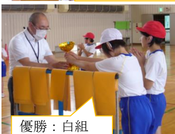
優勝：白組 準優勝：赤組