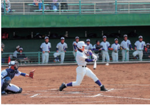
公式野球部：夏の高校野球 4回戦進出 (ベスト16)

ソフトテニス部女子 ハイスクールジャパンカップ全国大会出場 インターハイ6回戦進出 (高橋・藤村組)、 4回戦進出 (日高・千葉組)