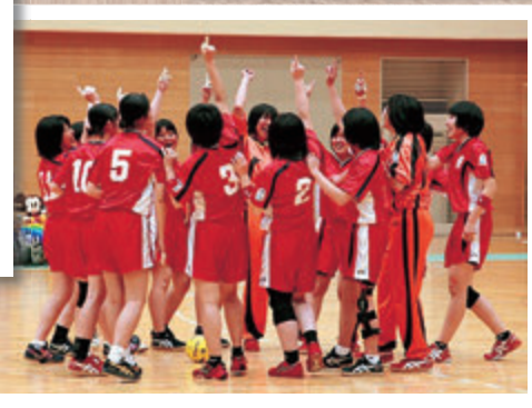
ハンドボール部女子：県新人大会第4位