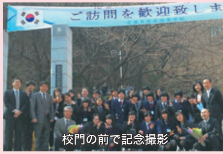
校門の前で記念撮影