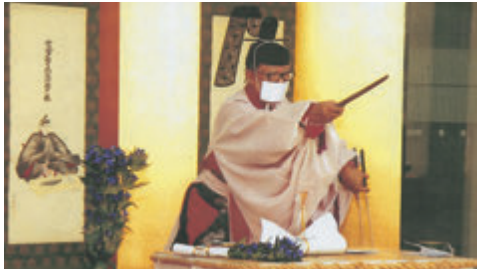
四條真流儀式庖丁式

私はここ数年は調理場を飛び出して、テレビやラジオ、専門学校、講演会を通して料理を教え、あるいは料理人の生き方について語る機会が多くなりました。ますます多忙を極める様になった訳ですが、それに乗るだけの沢山の心を得る事が出来ました。皆様にきちんと教え様とすると、私も