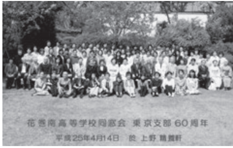
花南高等学校同窓会 東京支部 60周年 平成25年4月14日 於 上野 精養軒