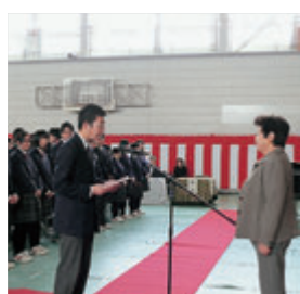
平成24年度同窓会入会式

その後、毎年七月に盛大に開催されている『同窓会定期総会』への出席を促す初の試みとして『平成25年