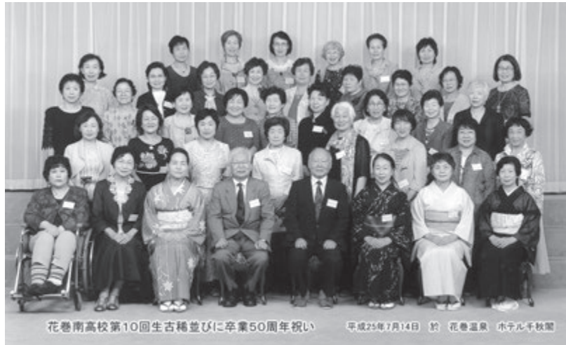
花巻南高校第10回生古稀並びに卒業50周年祝い 平成26年7月14日 於 花巻温泉 ホテル千秋閣

送っている人たちが、二十数万人もいます。 そんな中で、少しずつ元気を取り戻し、立ち上がろうと努力をしている人たちや、それを支え、応援を続けている人たちも沢山います。 新聞やテレビで、音