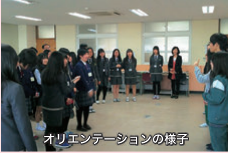
オリエンテーションの様子