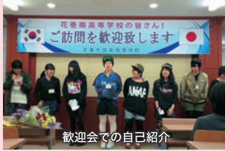
歓迎会での自己紹介