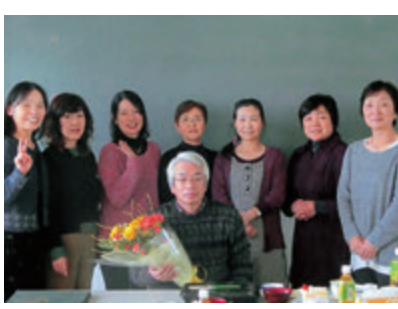
「卓球部OG会」 花巻市まなび学園3階研修室 (旧花巻南高校3年2組教室) (残念ながら1人が撮影していません)

スト4以上が当たり前、ベスト8位では恥ずかしいという全盛の時代でした。卓球部は、強豪久保学園高校(現盛岡誠桜高校)と双壁をなし、各種大会で優勝を争うなどすばらしい実績を残していました。その名門卓球部によくぞ新米素人顧問を就けさせたものだと思ながらT校長の苦渋の英断に感謝しているところで