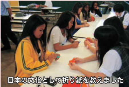
日本の文化として折り紙を教えました