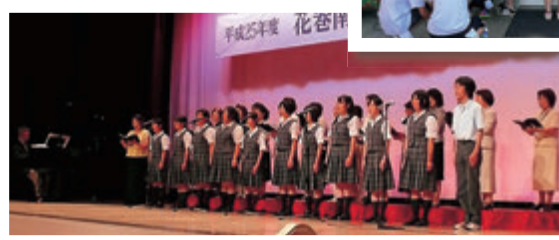
合唱部：同窓会総会をはじめ各種発表会に出演