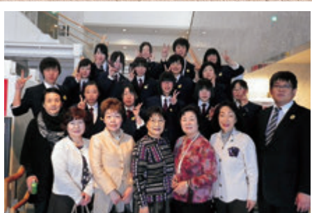
吹奏楽：全日本ポップス&ジャズバンドグランプリ大会出場 東京支部の同窓生と一緒に撮影