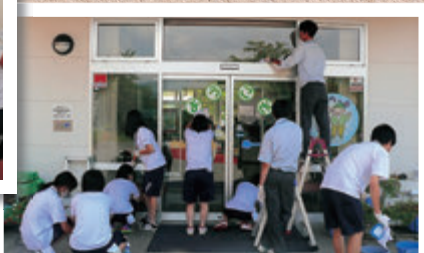
JRC部：被災地訪問 (清掃・交流活動)