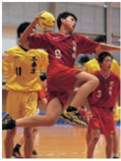
ハンドボール部男子 県高総体ベスト8 県新人大会ベスト8