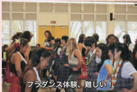
フラダンス体験、難しい!