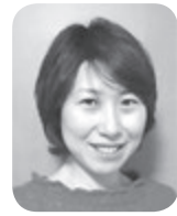
南高 校を卒業して から23

年が経ちました。長いようで短いように感じます。私は高校ではバレー部で3年間汗を流し、そして学校行事に燃え、仲間とともに過ごした時間は今では良い思い出になつていきます。