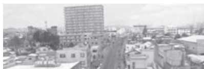
Mデパートの大食堂から高野台を望む

今まで出会つた多くの人々と、食事を共にすることで、心が打ち解けあつたり、楽しい発見もあつた。声を掛けられたら、喜んで食事を楽しめるように、健康な日々を過ごしたいと思う。