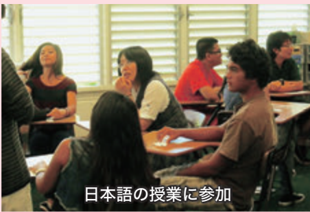
日本語の授業に参加