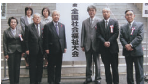
日々谷公会堂にて：写真左端

中国の大気汚染、マスクをしなければ外出出来ないなどのニュースを見るにつけても、日本にいる私達も一人一人がそのことに気をつけて暮らして行かなければならないと、あらためて思いました。