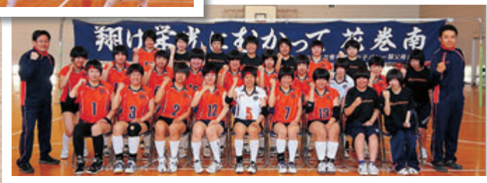
バレーボール部女子：県高総体ベスト8、新人大会ベスト8