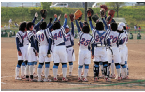
ソフトボール部：県新人大会ベスト8