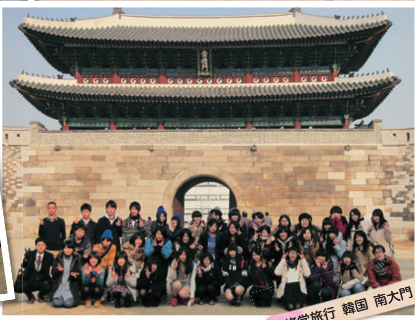
修学旅行 韓国 南大門