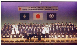
同窓生20名生徒98名の大会唱団によるオープニング「花南讃歌」