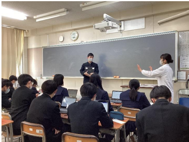
先生からの助言の様子⑤