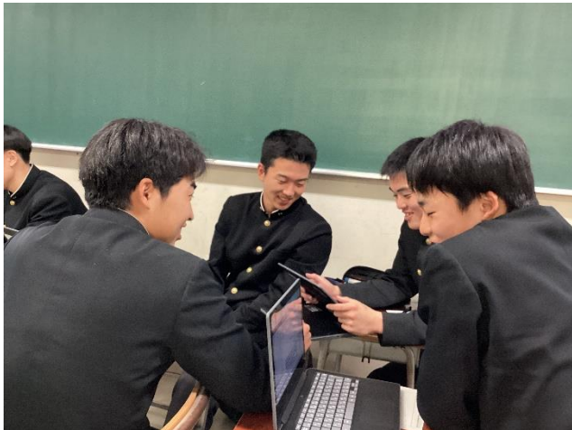
今後の計画を立てている様子③