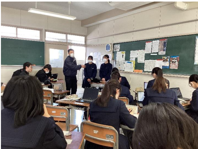
先生からの助言の様子①