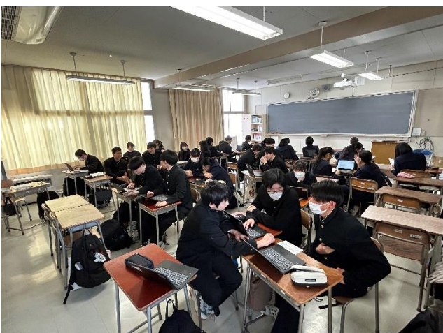
今後の計画を立てている様子⑤