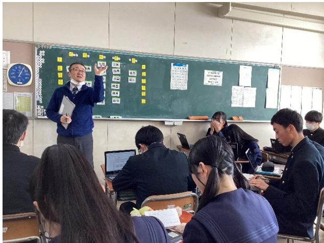
先生からの助言の様子③