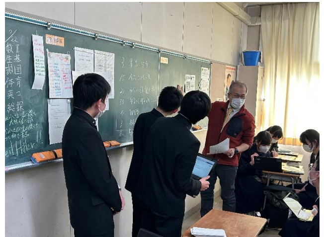
先生からの助言の様子④