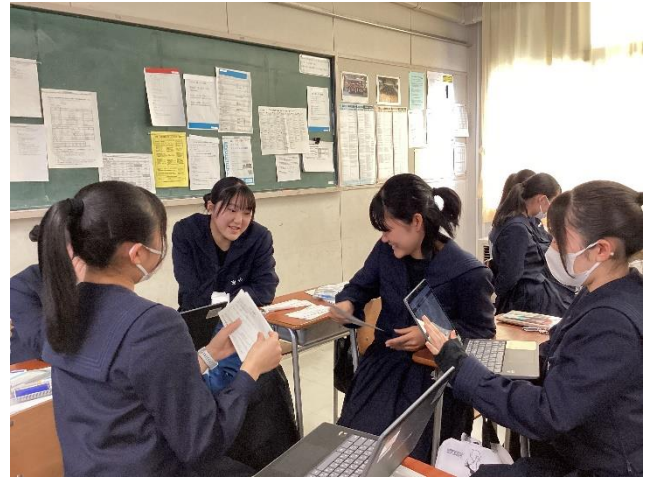
今後の計画を立てている様子②