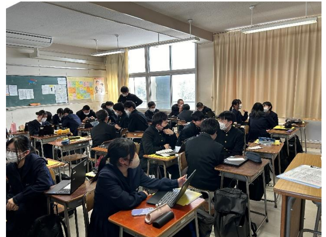
今後の計画を立てている様子④