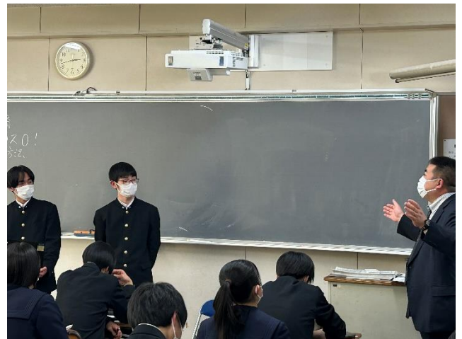
先生からの助言の様子②