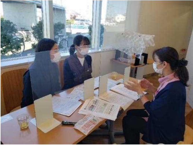
「岩手県予防医学協会」様にて、岩手の食と生活習慣病との関係についてインタビューしてきました。