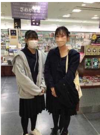
盛岡駅「さわや書店」様にて、参考文献を探してきました。