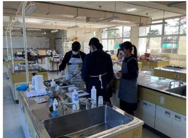
校内家庭科室でも研究を行いました。