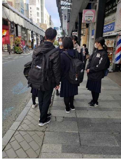
盛岡市内大通りで、作戦会議中です。