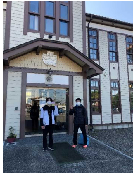
「奥州宇宙遊学館」様にて、宇宙での生活と宇宙食についてインタビューしてきました。