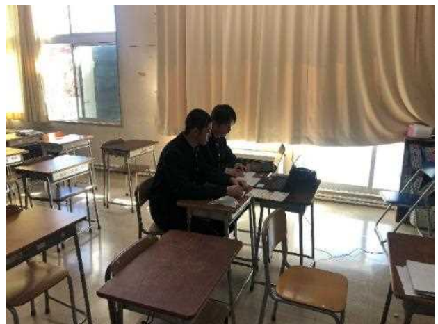
ZOOM を通して、インタビューしたグループもありました。