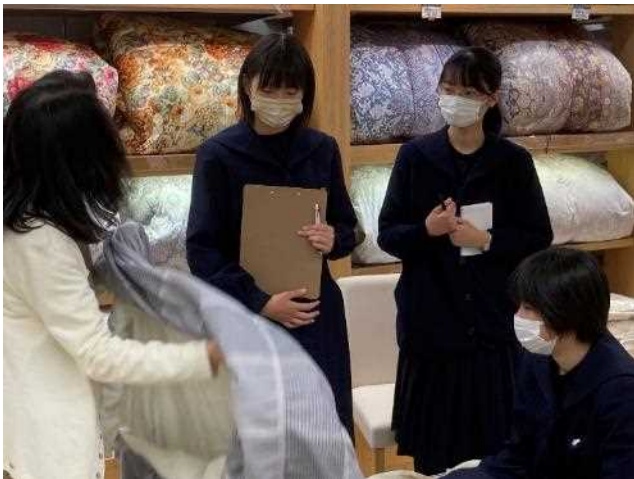
川徳「西川ショップ」様にて、睡眠の質を向上させるための寝具選びについてインタビューしました。