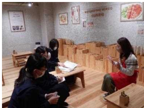
マルカン「おもちゃ美術館」様にて、幼少期の遊びと学びの関係性についてインタビューしてきました。