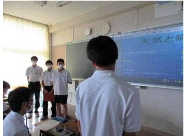
他のグループにも質問します