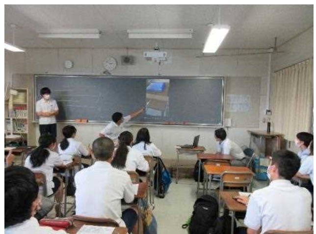
自作の動画も発表します