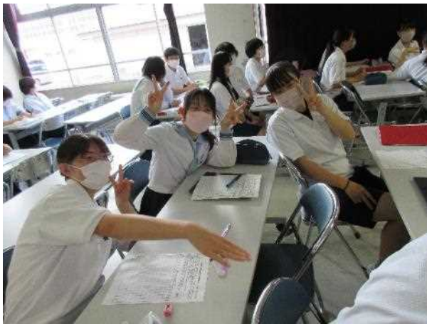
発表前のちょっとしたリラックス