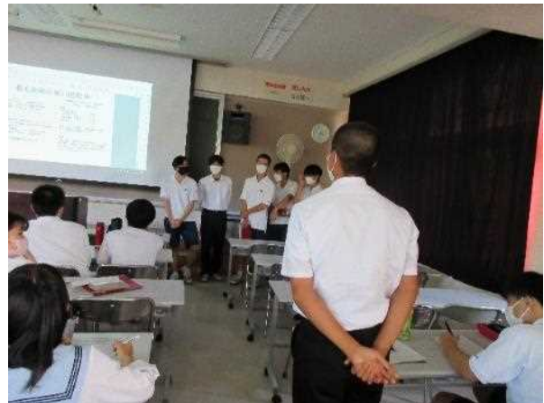
1年生も質問します