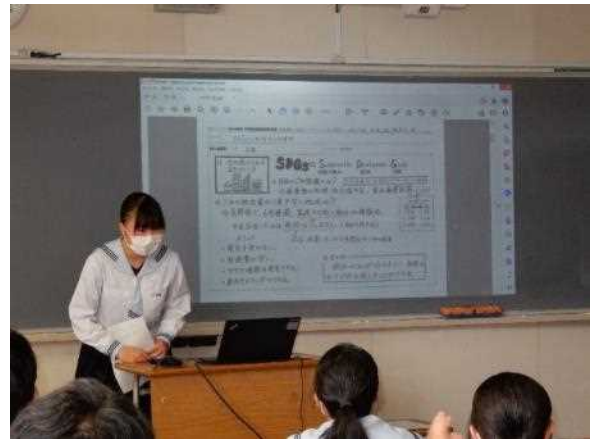
発表資料を1枚にまとめ、投影して発表します。 「SDGsと地域のゴミ問題」の発表