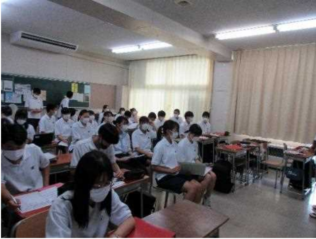
クラスによっては教室の配置を変えています