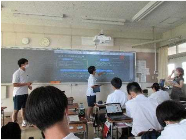
自作のスライドを使って発表