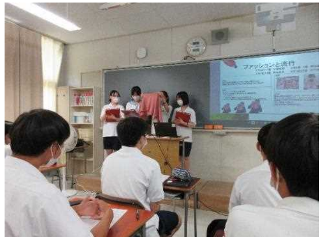
サンプルを見せながら発表