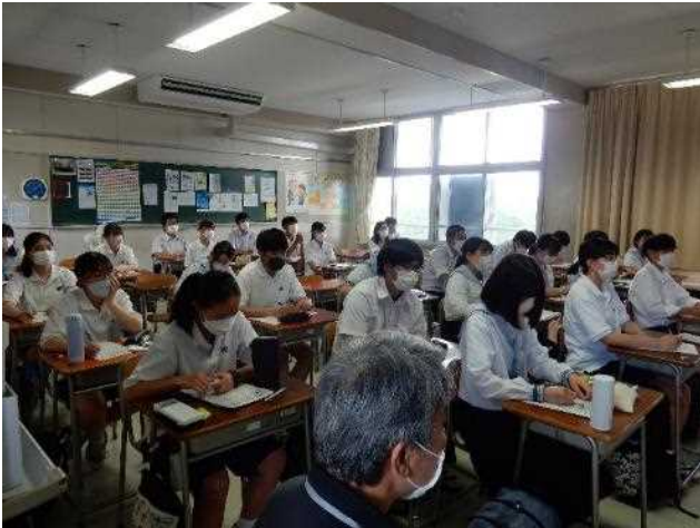
12の会場に分かれていよいよ開始! ドキドキ ワクワク