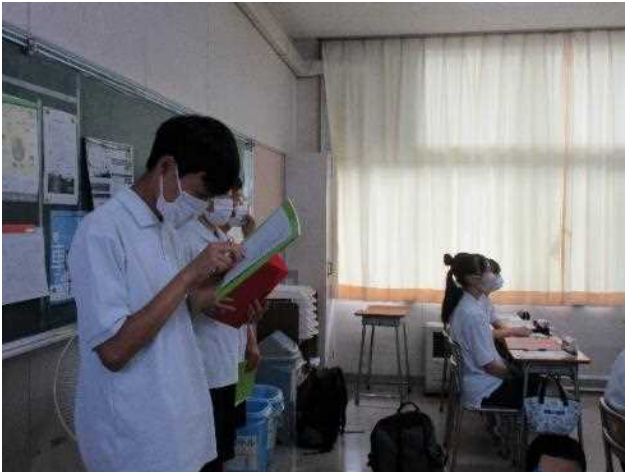
1年生も発表内容をメモします