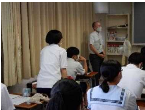
「発表ありがとうございます。質問です！」