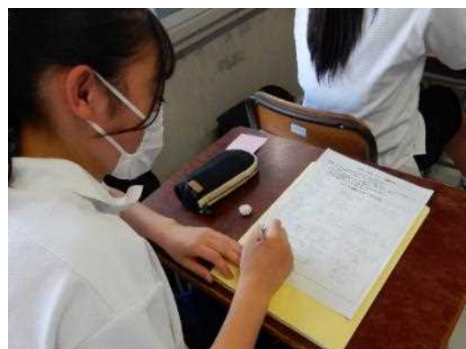
1年生も真剣に聞きます。メモ用紙はビッシリ。