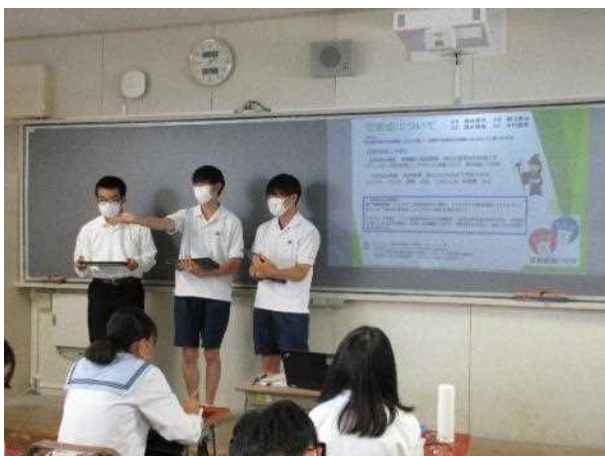
発表者も指名します