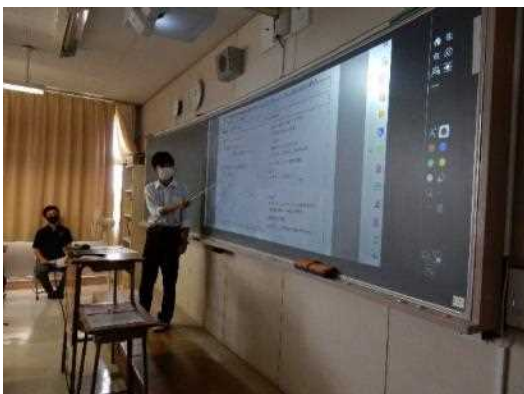
熱のこもった発表が続きます