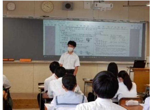
「何でもどうぞ！」(発表「腹痛を緩和する漢方を作る」)