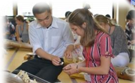
国際交流 ～花高から短期留学～