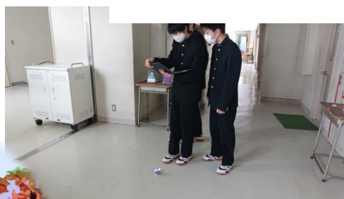
花巻北高校スペースプロジェクト ～2023年冬に花高生の 人工衛星を打ち上げ!～