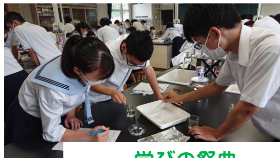
学びの祭典 ～花高の横断的授業～