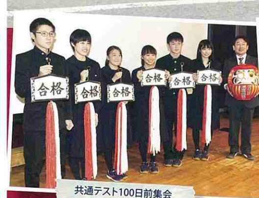
共通テスト100日前集会