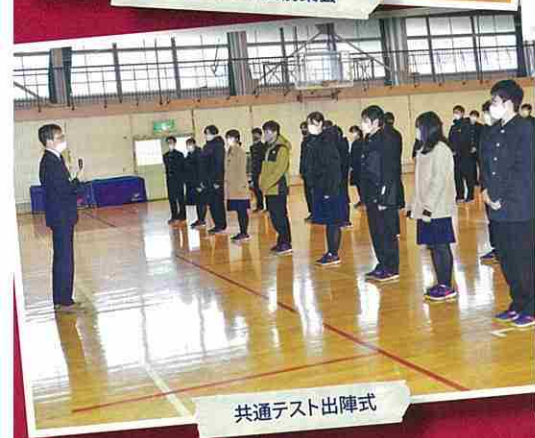
共通テスト出陣式