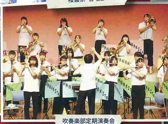
吹奏楽部定期演奏会