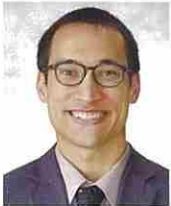
1学年付 スタイブンク ロフト