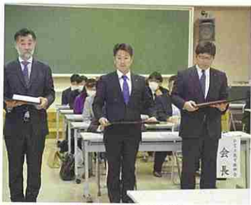
旧役員へ感謝状贈呈