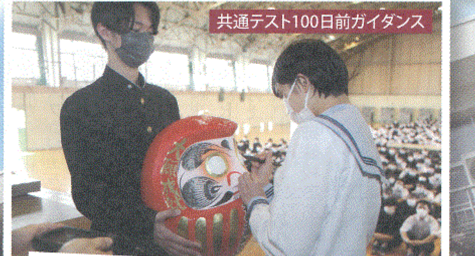
共通テスト100日前ガイダンス