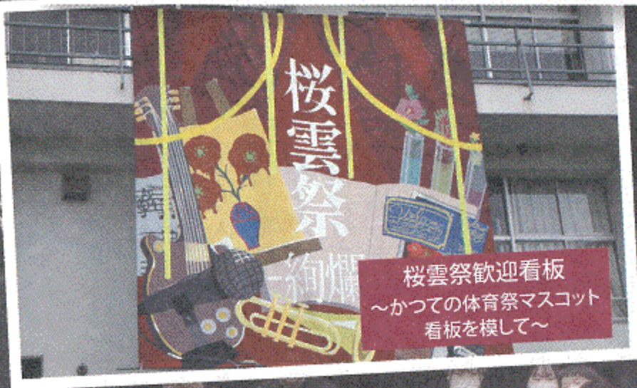
桜雲祭歓迎看板 ~かつての体育祭マスコット 看板を模して~