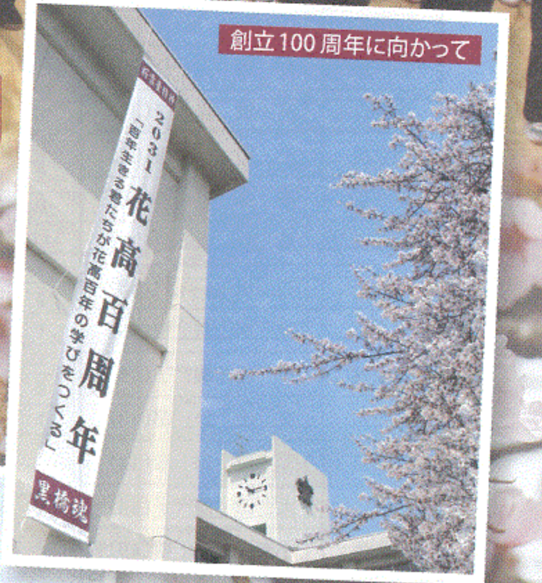
創立100周年に向かって