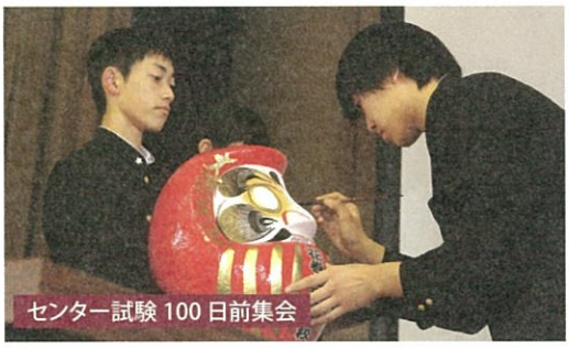
センター試験 100 日前集会