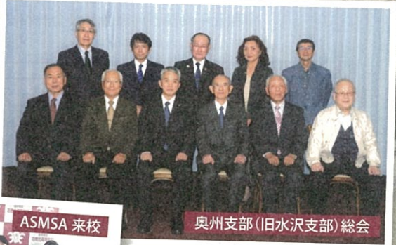
奥州支部(旧水沢支部)総会