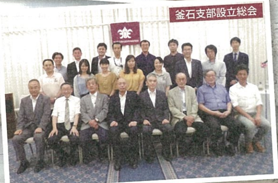
釜石支部設立総会