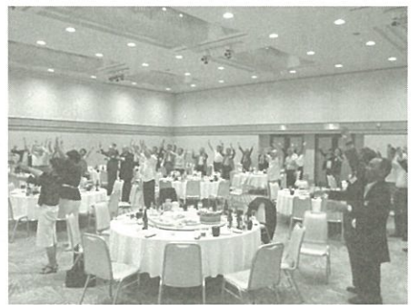
懇親会・万歳三唱