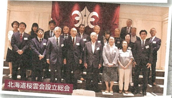
北海道桜雲会設立総会