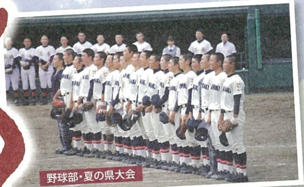
野球部・夏の県大会