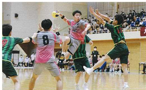
ハンドボール部(男子: 県高体連強化拠点校)