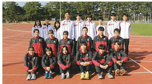
陸上競技部(男子: 岩手県特別強化指定校)