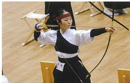
弓道部(女子: 県高体連強化拠点校)