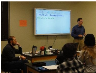
ASMSA の授業 (物理)

ASMAS に限らないかもしれませんが、少人数制教育を基本としています。物理の授業を最初に見ましたが、「この授業はちょっと人数が多くて」と言われて「何人ですか?」と質問すると、「19人です」とのことでした。19人で多い方になるわけで、もっと少ない人数の授業もありました。