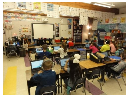
コンピューターを 使った授業 (小学生)

コンピューターの導入に関してはアメリカの方がかなり進んでいると言えます。小学校1年生程度からコンピューターを習い始め、学年が上がるにつれてノートパソコンを自宅にもって帰ることが許されます。小学生が算数の勉強にノートパソコンを使っているのを見ましたが、授業に見事にマッチしているようでだいぶ慣れてる感じがありました。ただし、低学年の生徒は長時間は使わせていないようで、10分程度とのことでした。コンピューターを活用できるツールとしてとらえてどんどん活用していく。そのために全員分のパソコンを揃えるといった姿勢でした。また、ノートパソコンが全員にあるのに、立派なコンピューター室は別にあるわけですから驚きです。