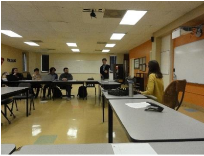
ASMSA の授業 (日本語：文 学)