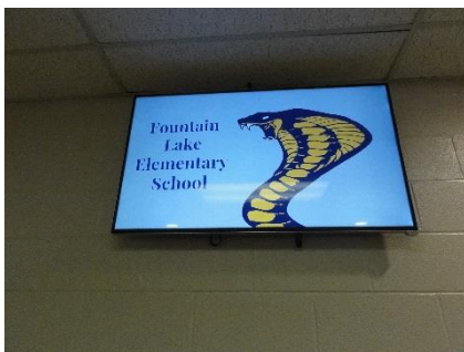
ファウンテンレイクの マスコットはなぜ カコブラ (もちろん) コブラはいない)

今回は2つの学校を訪問することができました。ファウンテンレイクス쿨とレイクサイドスクールという学校で小学校入学前の子どもから高校生までが通う大規模の学校でした。