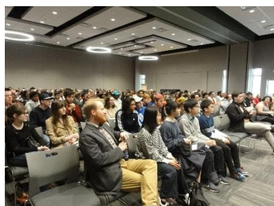
A S M S A 全校集会 の様子