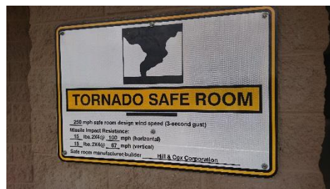
竜巻用の 避難施設 アメリカなら ではの施設