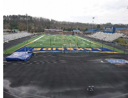
レイクサイドス ールの競技 場

コンピューターの導入に関してはアメリカの方がかなり進んでいると言えます。小学校1年生程度からコンピューターを習い始め、学年が上がるにつれてノートパソコンを自宅にもって帰ることが許されます。小学生が算数の勉強にノートパソコンを使っているのを見ましたが、授業に見事にマッチしているようでだいぶ慣れてる感じがありました。ただし、低学年の生徒は長時間は使わせていないようで、10分程度とのことでした。コンピューターを活用できるツールとしてとらえてどんどん活用していく。そのために全員分のパソコンを揃えるといった姿勢でした。また、ノートパソコンが全員にあるのに、立派なコンピューター室は別にあるわけですから驚きです。