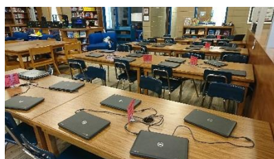
教室には PC が 完備

今回が2年目の派遣事業であり、初の単独の（花北だけの）訪問でしたが、この姉妹校として関係を大切に、毎年数名の生徒を派遣できれば良いのではと考えます。