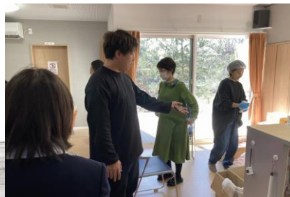
いんくるりんく（北上）