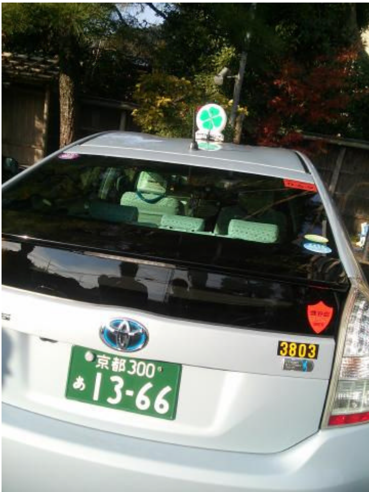
珍しい四つ葉タクシーです。