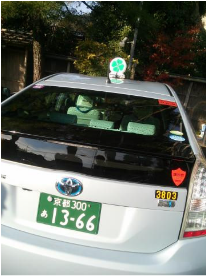
珍しい四つ葉タクシーです。