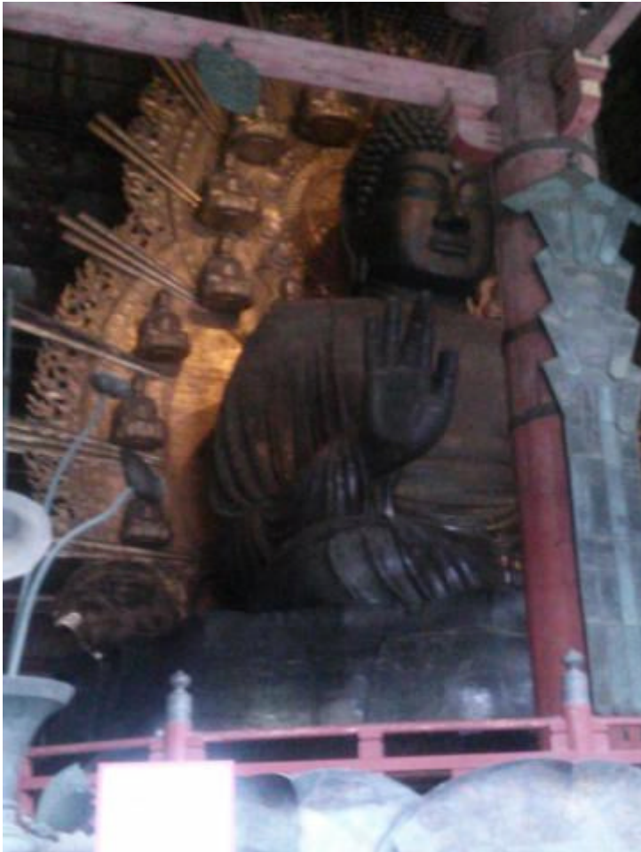
圧倒されっぱなし。