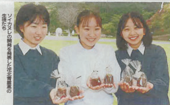
ソイカヌシの開発を発表した花北青雲高の生徒たち

を通じて自ら考え行動し、まちづくりを主体的に担うことや、地域の活性化を推進する活動などを通して、市内の高校生が、お祭り目当てに「夢の橋・未来へカケル文」企業や福祉施設を共同で開催した。