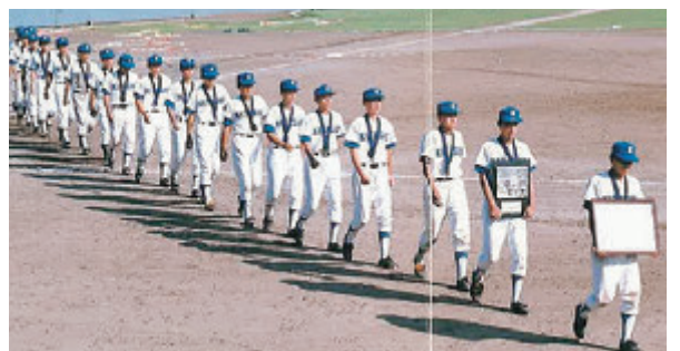
92年岩手県大会準優勝