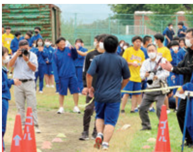
ロードレース大会

感染防止対策と教育内容の充実の両立を図り、今後も地域との絆を深め、生徒の力を伸ばす教育活動に邁進する所存ですので、同窓生の皆様の温かいご支援を引き続きどうぞよろしくお願いたします。