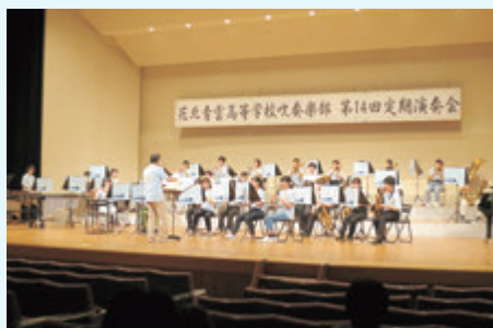
吹奏楽部定期演奏会