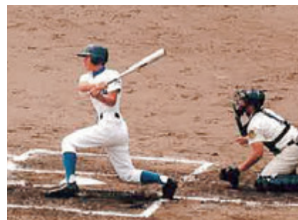
97年岩手県大会準優勝