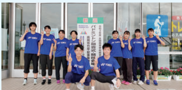
バドミントンインターハイ

なく、楽しく過ごしてい きたいと思つています。そして、 家族と仲間に支えられて今 の自分があることに感謝 し、自分自身も周りの人の 支えになれるよう日々成長 していきます。