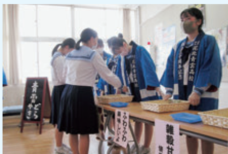
青雲どら焼き校内販売