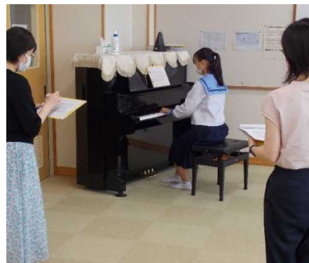
音楽・リズム表現技術 2 級