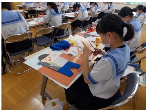
造形表現技術 1 級 課題「運動会」