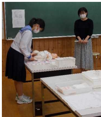
家庭看護技術 2 級 おむつ交換の様子