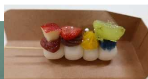
からふる一つだんご