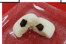
洋風きりせんしょ