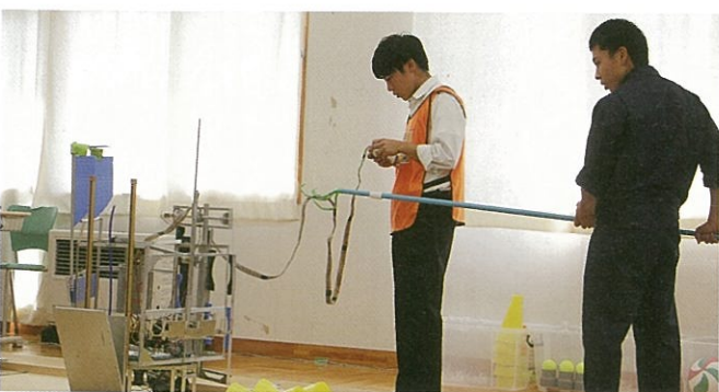
ロボット競技大会

一万六二七一名の減少というこの数字を考えてみます。四十人学級で換算すると四〇六学級減少していることとなります。一学年五学級規模の学校でいえば、二十七校がなくなっているもおかしくない数字です。現実には統廃合等でなくなったものは、県土の広さや、交通事情が配慮され、そこまで減少していないのが現状です。