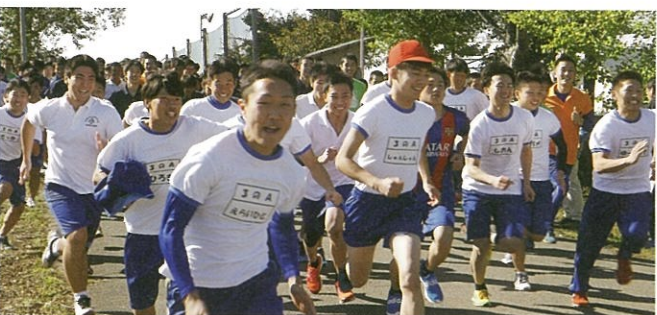
ロードレース大会

少子高齢化という人口構成の変化に追いつけない社会が様々な問題を生み出していることは、紛れもない事実です。高校再編の問題も反対運動が起これば、すぐに公表した計画に待たがかります。なかなか前に進む気配が見られませんが、抜本的な改革が必要なのに、このままどこかの学校が勢いを失っていくのを見定めて統廃合をするのでしょうか？そういう考えは、「学校同士を競争させている」という見方が出来ます。