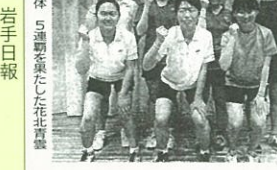
女子団体 5連覇を果たした花北青雲