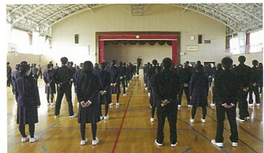
新入生応援歌練習

活科各一学級を合わせて四 学級となり、新設科に対応 した施設の整備にとどまら ず、商業科系についても時 代に即応した設備を導入す るなど、優れた教育環境が 整った新校舎を整備してい ただきました。 しかしながら、あれから 十二年。平成二十七年十二 月に新たな県立高等学校再 編計画が示され、本校は平 成三十二年度からビジネス 情報科が一学級減となるも のでした。本計画は時間を かけて様々な角度から分 析・検討した結果でしやう し、少子化の影響も大きい と思いますが、花巻市・北