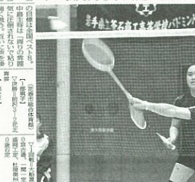
女子は花北青雲 攻め貫き5年連続頂点