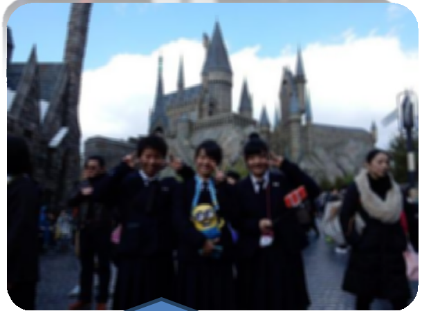
短い時間だったけど、楽しい時間を過ごせました！ 良い思い出もできました！！