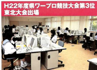
H22年度県ワープロ競技大会第3位 東北大会出場