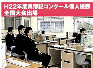
H22年度県簿記コンクール個人優勝 全国大会出場