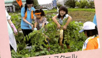
●JAちやぐりんスクール