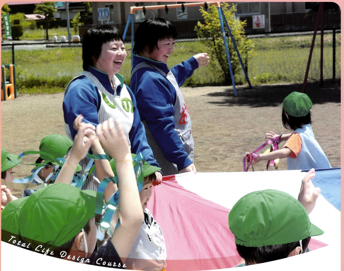
Total Life Design Course

コミュニケーション能力を伸ばしながら、衣食住や保育、高齢者の看護や介護などを専門的に学びます。