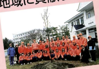
●石鳥谷レオクラブ