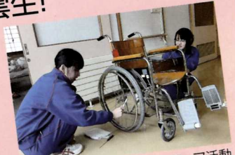
●いしどりや荘でのボランティア活動