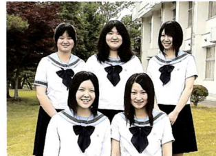
●PFSC(ボランティア)同好会