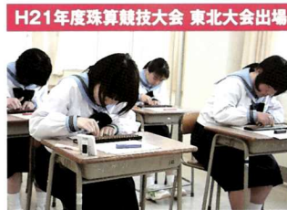
H21年度珠算競技大会 東北大会出場