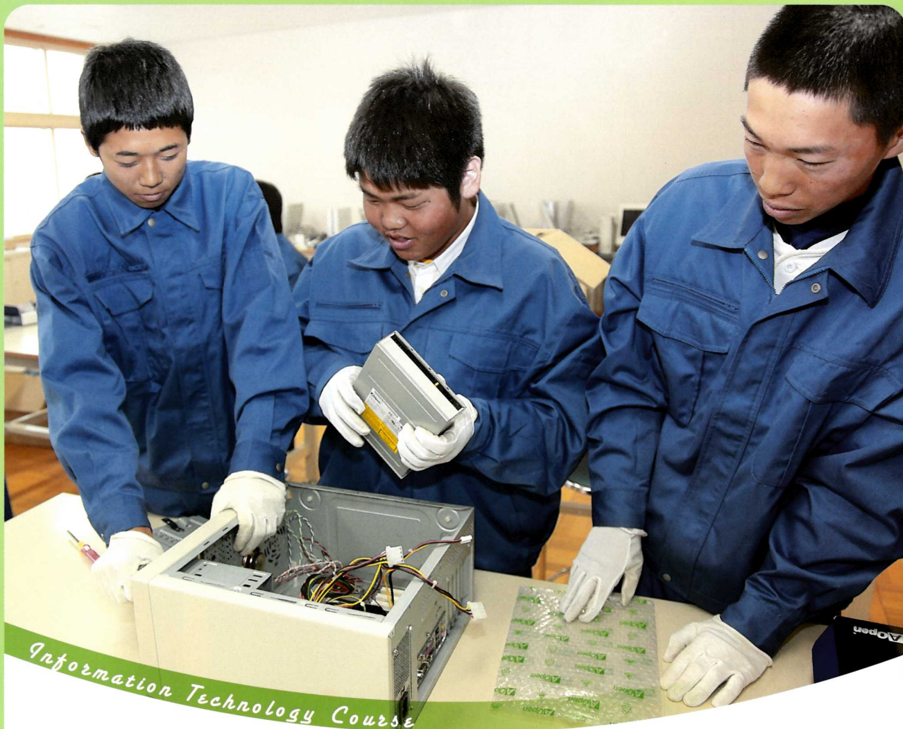
Information Technology Course

コンピュータシステムのハードウェア、ソフトウェア両面の学習をし、通信ネットワーク技術やメカトロニクス技術を体験的に学びます。