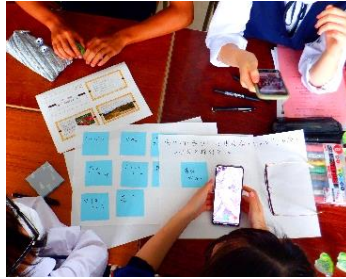
「花と泉の公園」様の協力をいただきながら、公園の活性化に向けたアイディアを付箋に書いて提案し合うグループ。