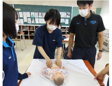
「北日本カレッジ」様、「一関青年会議所」様の協力をいただきながら、保育に関わる実践を行うグループ。