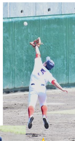
躍動する花高野球部！