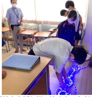
「花泉支所」様の協力をいただきながら、12月に行うイルミネーションの実施方法について考察するグループ。