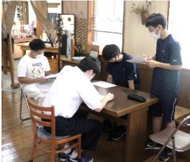
「古代米おりざ」様の協力をいただきながら、新メニューのブレゼンを行うグループ。

9月1日（木）の5・6校時に今年度2回目の探究活動を行いました。次の写真は、その時の様子になります。