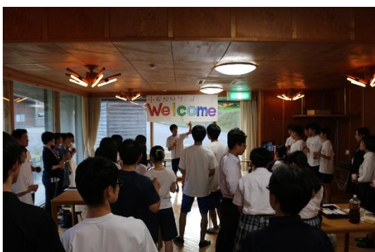
前夜は歓迎会を開いてもらいました。

平成31年8月1～2日に私たち生徒会執行部は、山形県立小国高等学校主催の第一回全国小規模校サミットに参加してきました。