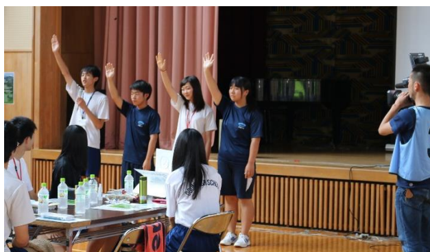
地元のテレビ局も取材に来ました。