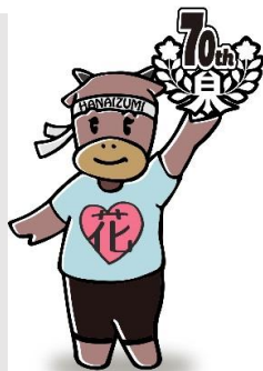
70周年記念 マスコットキャラクター Hanaちゃん